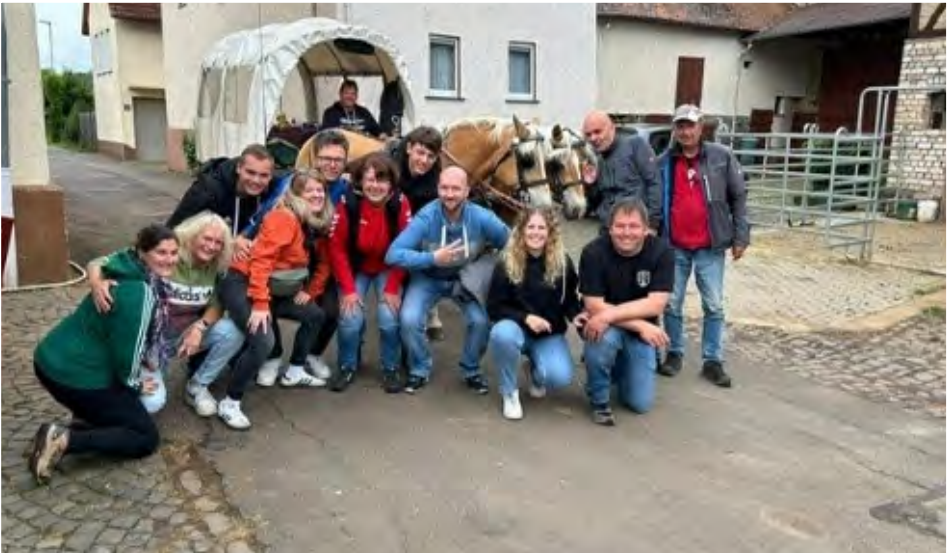
Saisonabschlussfeier mit Stil