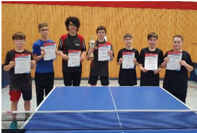
Erfolgreiche Schüler- und Jugendspieler des Vereins

Für die neue Saison geht der SV Saasen mit 3 Senioren- ( 2-mal Herren und 1-mal Damen) und 3 Jugendmannschaften an den Start.