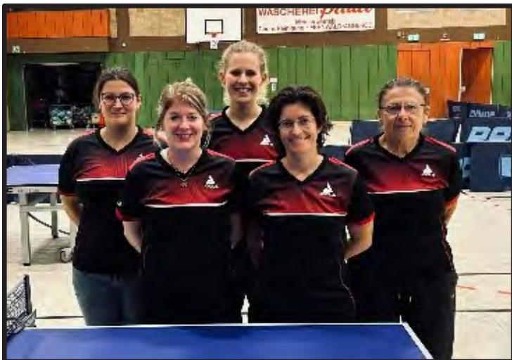
Die TT-Damenmannschaft des SV 1936 Saasen