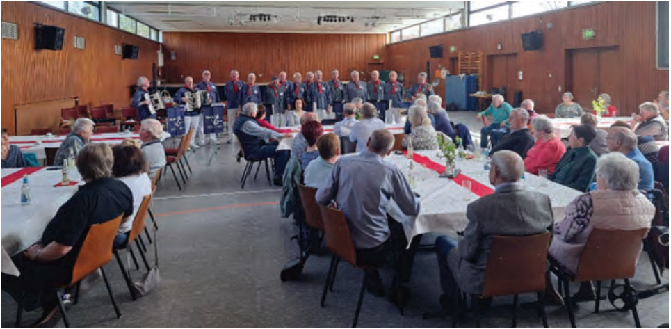
Beste Unterhaltung durch die Lieber Shanty- Crew